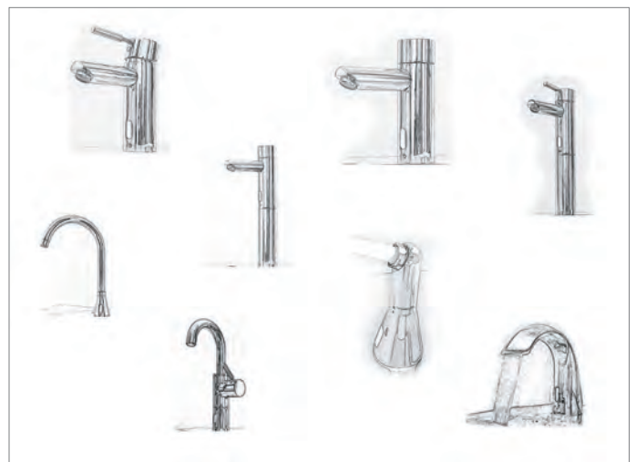
Kleiner Einblick in die große Produktpalette der Armaturen von LOex LOTZ Exim Trading.

Nicht nur in professionellen Anwendungsbereichen und in öffentlichen Räumen sind die Sensorarmaturen eine gute Wahl. Auch